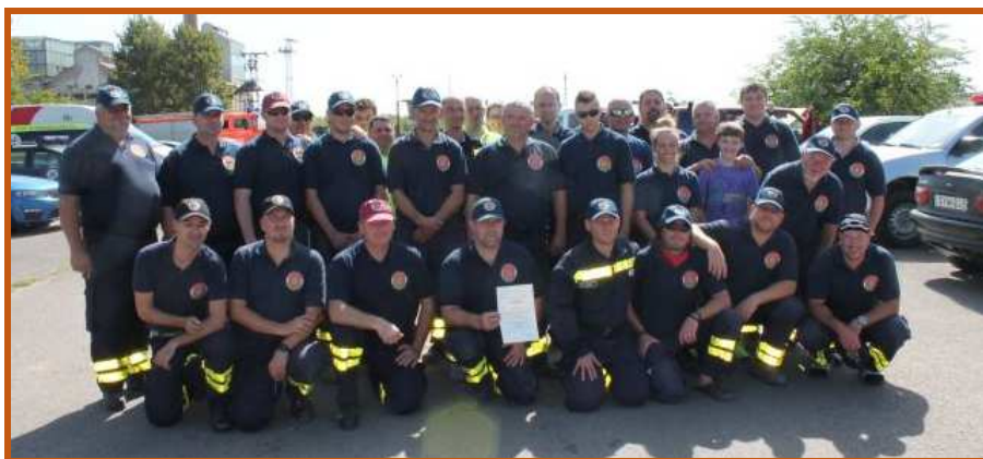
A Körös Mentőcsoport tagjai a Nemzeti Minősítő Oklevéllel

A nemzeti minősítő rendszer keretében szervezett, öt évente kötelezően végrehajtásra kerülő, minősítést megújító törzsvezetési és terepgyakorlatot teljesített Mezöhegyesen a Körös Mentőcsoport 42 tagja, melyen a BM OKF minősítést végző szakemberei előtt zajlott.