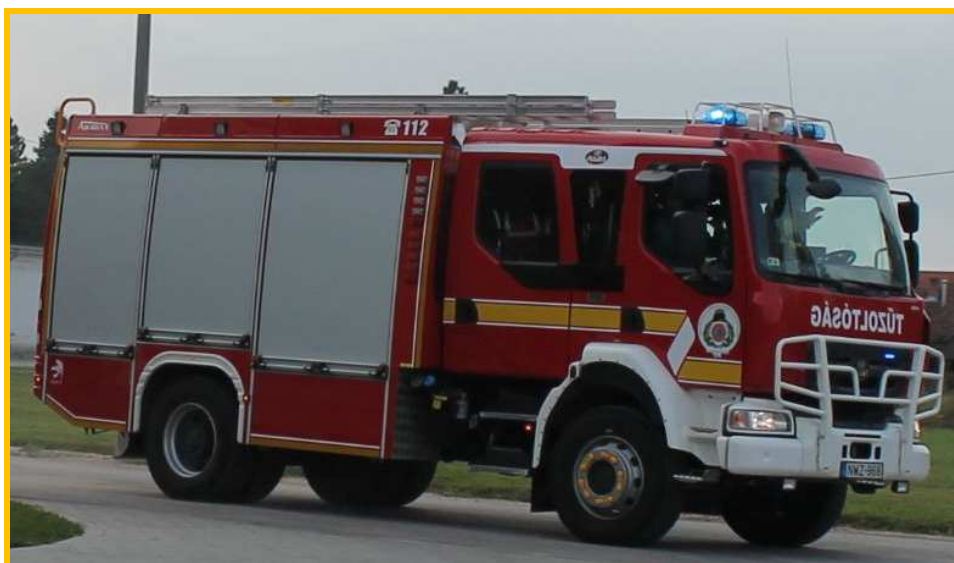
RÁBA-HEROS AQUADUX-X 4000 típusú gépjárműfecskendő

KEHOP-projekt keretében az igazgatóság 2 db HEROS AQUADUX-X 4000 típusú gépjárműfecskendőt állított rendszerbe, így 2017. év végére megyékben valamennyi hivatásos tűzoltó-parancsnokság rendelkezett a magyar gyártású gépjárműfecskendővel.