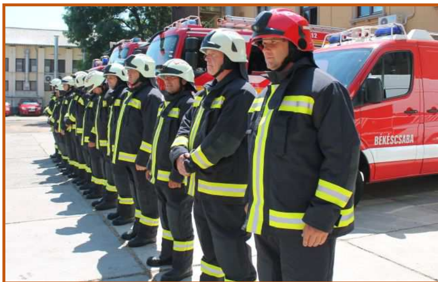
Békéscsabai tűzoltók az új védőruházatban

Az egyéni védőeszközzel történő ellátás helyzete folyamatosan javuló tendenciát mutat. A korábban használatban lévő tűzoltó bevetési védőruhák parancsnokságonként eltérő típusúak voltak, állapotuk is szélsőségeket tükrözött. Azonban megtörtént egy korszerű, új, hazai gyártású bevetési védőruha – az R13 - kifejlesztése. A központi finanszírozásnak és a saját beszerzésnek köszönhetően egyéni védőruha ellátás tekintetében a tűzoltóságok között tapasztalható különbségek kiegyenlítődték, a beavatkozó állomány mára rendelkezik megfelelő méretű és minőségű egyéni védőruházattal.