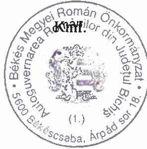
Szatmári Ilona jegyzőkönyv-hitelesítő