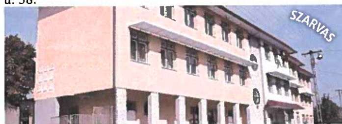
Gyulai SZC Székely Mihály Szakgimnáziuma Szakközépiskolája és Kollégiuma - Szarvas, Vajda Péter u. 20.