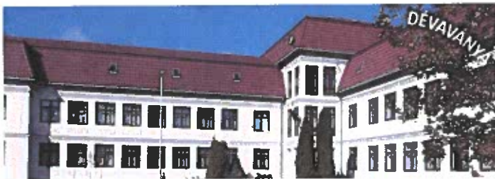
Gyulai SZC Dévaványai Szakgimnáziuma Szakközépiskolája és Kollégiuma - Dévaványa, Mezőtúri u. 2.