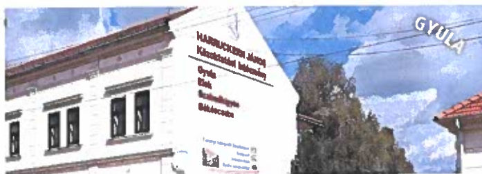
Gyulai SZC Harruckern János Szakgimnáziuma Szakközépiskolája és Kollégiuma - 5700 Gyula, Szent István u. 38.