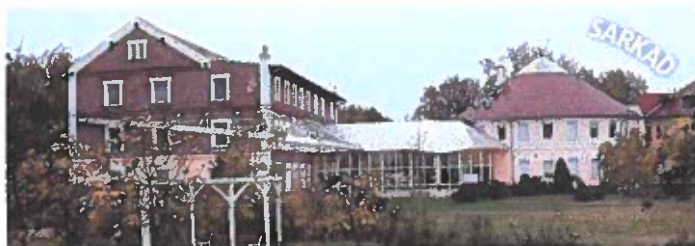
Gyulai SZC Ady Endre - Bay Zoltán Szakgimnáziuma és Szakközépiskolája - Sarkad, Piac tér 4.

A Gyulai Szakképzési Centrum (Gyula, Szent István u. 38.) 6 tagintézményt foglal magába: