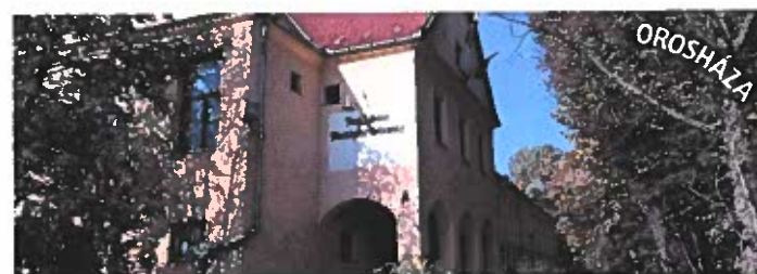
Gyulai SzC Kossuth Lajos Szakgimnáziuma Szakközépiskolája és Kollégiuma - Orosháza, Kossuth tér 1.

A zavartalan működéshez, feladatellátáshoz szükséges feltételeket a centrum biztosítja.