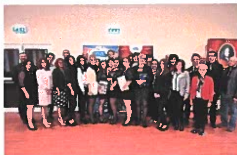
Centrum elismerő ünnepség résztvevői