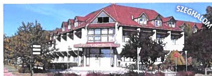
Gyulai SZC Szigeti Endre Szakgimnáziuma és Szakközépiskolája Szeghalom, Ady Endre u. 3.