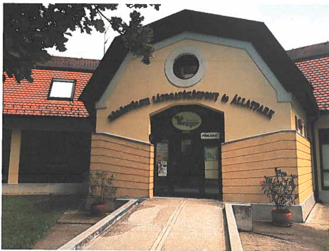
A Körösvölgyi Látogatóközpont és Állatpark bejárata

A Biharugrán működő Bihari Madárvárta idén ünnepelte fennállásának tízedik évfordulóját. Megnyitása óta nemcsak mint komfortos szálláshely és rendezvényhelyszín vált a régió turisztikai bázishelyévé, hanem mint színes programok és tematikus túrák kiindulópontja is. Igazgatóságunk 2012-ben fűtéskorszerűsítést hajtott végre az épületegyüttesen, melynek köszönhetően azóta a Madárvárta az év minden napján várja szállóvendégeit. Az erdei iskola környezettudatosságra nevelő táborok, szakmai műhelymunkák helyszíne. A szállásépületben 6 db 3+3 ágyas fürdővel ellátott lakrész és 3 db 2 ágyas, szintén külön fürdővel rendelkező szoba található, így összesen 42 fő elszállásolására alkalmas. 90 m 2 -es nagyterme előadások, értekezletek, gyakorlati foglalkozások lebonyolításának optimális színtere. Minden május harmadik hétfőjén 2013 óta kerül itt megrendezésre a Bihari Táj Napja című rendezvény, mely a régió egyik legnépszerűbb programjává nőtte ki magát. A fejlesztéseket a Madárvárta mellett található Sző-réti tanösvény kialakítása és 2016. évben történő átadása folytatta, melynek köszönhetően már nemcsak szállóvendégek látogatnak el ide.