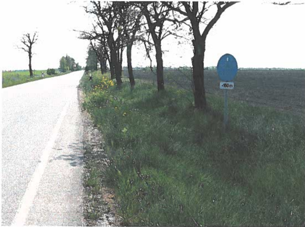
Mezőkovácsháza- Battonya közötti út menti helyi jelentőségű védett természetvédelmi terület