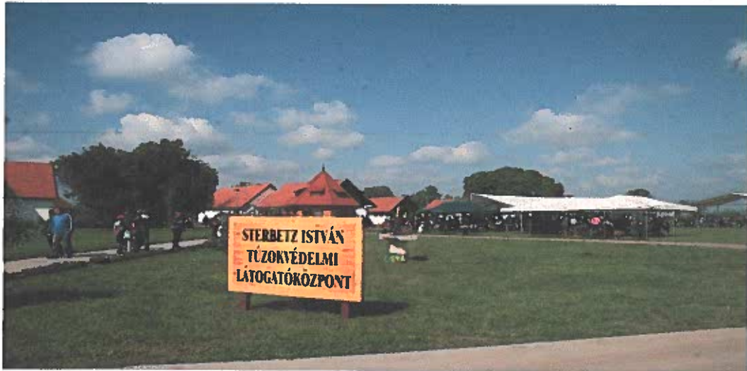
Sterbetz István Tűzokvédelmi Látogatóközpont

A következő három év folyamán Igazgatóságunk kiemelt fejlesztéseket hajtott végre a Sterbetz István Tűzokvédelmi Látogatóközpont területén a Környezeti és Energiahatékonysági Operatív Program keretében elnyert, több mint 236 millió forint forrás felhasználásával. A projekt megvalósítása során többek között új, a modern kor elvárásainak megfelelő, állandó kiállítás készül el a múzeumi épület emeleti részén, új állatbemutató épület épül, illetve felújításra kerül a Réhelyi tanösvény.