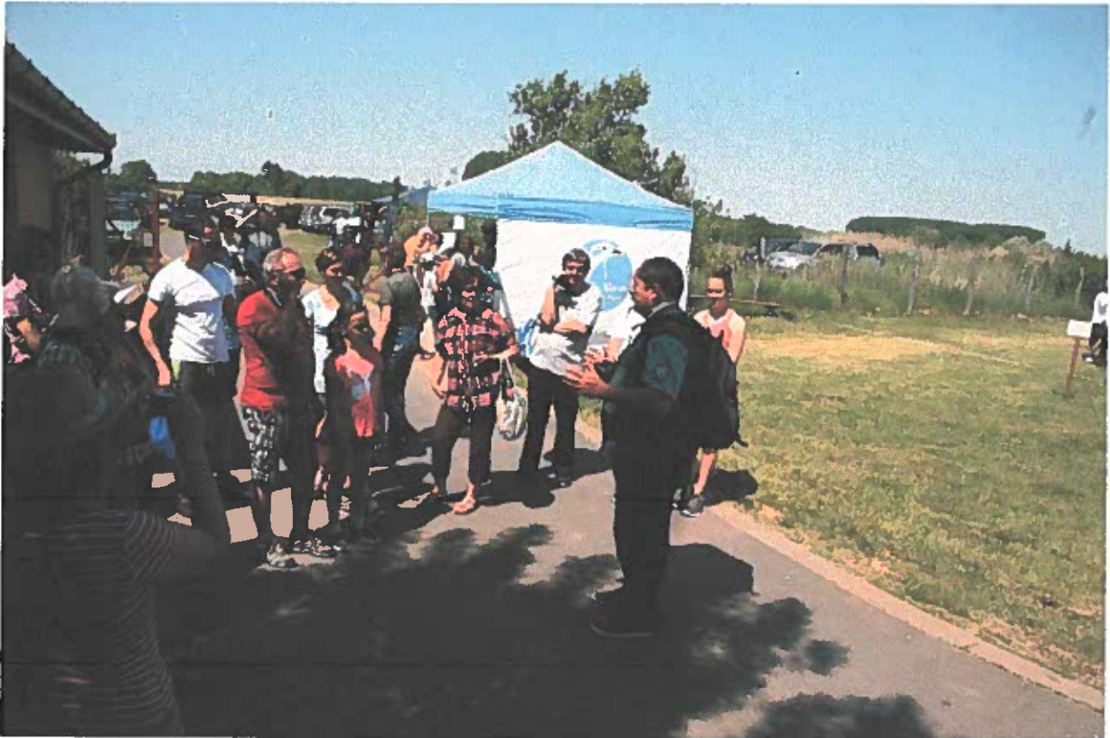
Túra indul a Bihari Táj Napján a Madárvár-táró

Igazgatóságunk az „A kék vércse védelme a Kárpát-medencében” című LIFE+ program keretében, a szakmai program megvalósítása mellett, fontos fejlesztéseket eszközölt a Kardoskúti Múzeum épületében. Az épület belső tereinek megújítása mellett elkészült egy új interaktív kiállítás, mely a Kardoskúti Fehér-tó természeti értékeit és hazánkban egyedülálló módon a madárvonulást mutatja be a XXI. század elvárásainak megfelelően. A Körös-Maros Nemzeti Park Igazgatóság legrégebbi és egyben legnépszerűbb programjának, a Fehértó Napja című rendezvénynek idén már tizennyolcadik alkalommal adott otthont a Kardoskúti Múzeum.