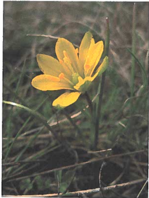
A pusztai tyúktaréj (Gagea szovitzii) mindössze néhány éve került elő a Nemzeti Parkban, egyben az országban is először.