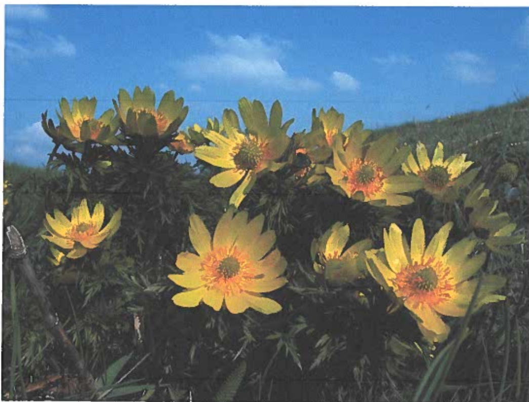
Magyarország első fokozottan védett növényfaja, az erdélyi hérics (Adonis hybrida) hazánkban csak Békés megyében fordul elő.

Magyarországon jelenleg közel 1400 vadonélő növény- és állatfaj áll területtől független természetvédelmi oltalom alatt, ezeknek mintegy harmada a Körös-Maros Nemzeti Park Igazgatóság működési területén is előfordul. Megkülönböztetett figyelmet érdemelnek ezek közül azok a fajok, amelyek állományának meghatározó része fordul elő Békés megye területén, mint az erdélyi hérics ( Adonis transsylvanica ) a bókoló zsálya ( Salvia nutans ), a dobozos pikkelyes csiga ( Hygromia kovacsi ) vagy a túzok ( Otis tarda ), amelynek megőrzése a Nemzeti Parknak nemzetközi egyezmények alapján is kötelezettsége.