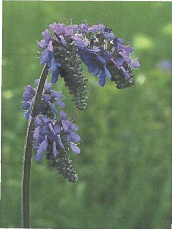
Sztyepei maradványfaj a bókoló zsálya (Salvia nutans). Szintén csak Békés megyében fordul elő hazánkban.