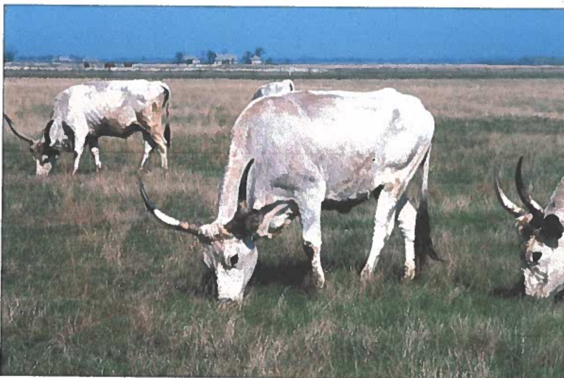
Legelő szürkemarha a kardoskúti pusztán

A védett természeti területek élőhely fenntartási munkái egyre több helyen régi magyar háziállat fajtákkal történő legeltetéssel történnek. Az extenzív legeltetéses gazdálkodás kedvező a gyepeket faj összetételére, ugyanakkor élőhelyet biztosít a legelőkhöz kötődő madárfajok (pl.: vörös és kék vércse, ugartyúk, tűzok, stb.) és emlősök (pl.: ürge) számára. A nemzeti kincssé nyilvánított védett őshonos és veszélyeztetett állatfajták, mint a magyar szürke szarvasmarha , házibivaly , racka és cigája juh, a természetes gyepek kezelési feladatain kívül idegenforgalmi értékkel bíró tájképi elemként is szolgálnak. Kulturális örökségünk részeként szerepet kapnak a hagyományörzésben, ezek a gulyák és nyájak a pásztor hagyományok fennmaradásának legjelentősebb helyszínei.