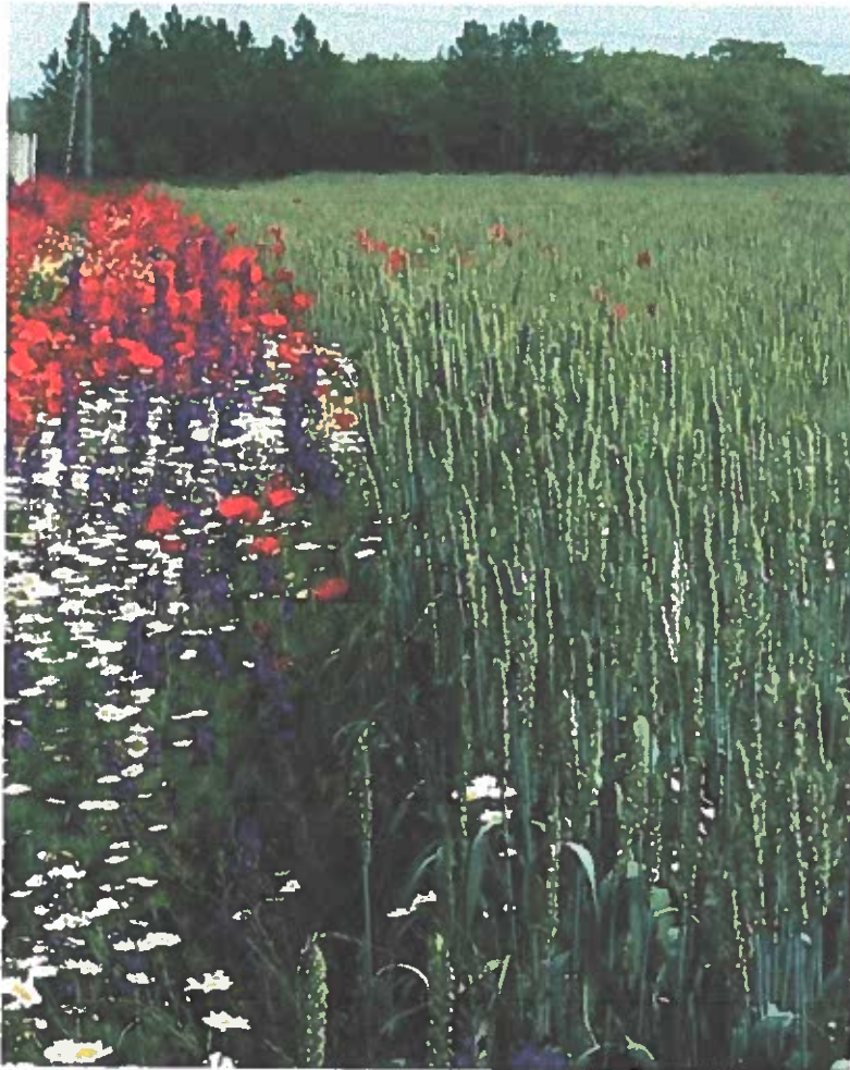
Virágos táblaszegély egy Magas Természeti Értékű Területen

A Natura 2000 hálózat kijelölése és kihirdetése után megjelent a 269/2007. (X. 18.) Korm.rendelet a NATURA 2000 gyepterületek fenntartásának földhasználati szabályairól a Natura 2000 gyepterületeken történő gazdálkodáshoz nyújtandó kompenzációs támogatás részletes szabályairól, amely alapján évente 69 euró támogatás vehető igénybe hektáronként. A nemzeti park igazgatóság, a Natura 2000 hálózathoz tartozó szakmai feladatokon túl, szakértőként közreműködik a program végrehajtási folyamatában.