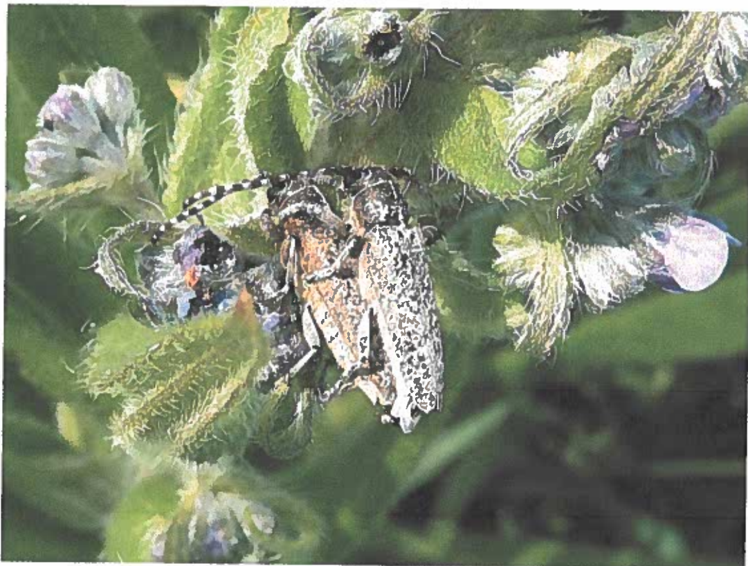
Az atracélcincér (Pilemia tigrina) hazánkban csak a Körös-Maros közén és a Mecsekben fordul elő.