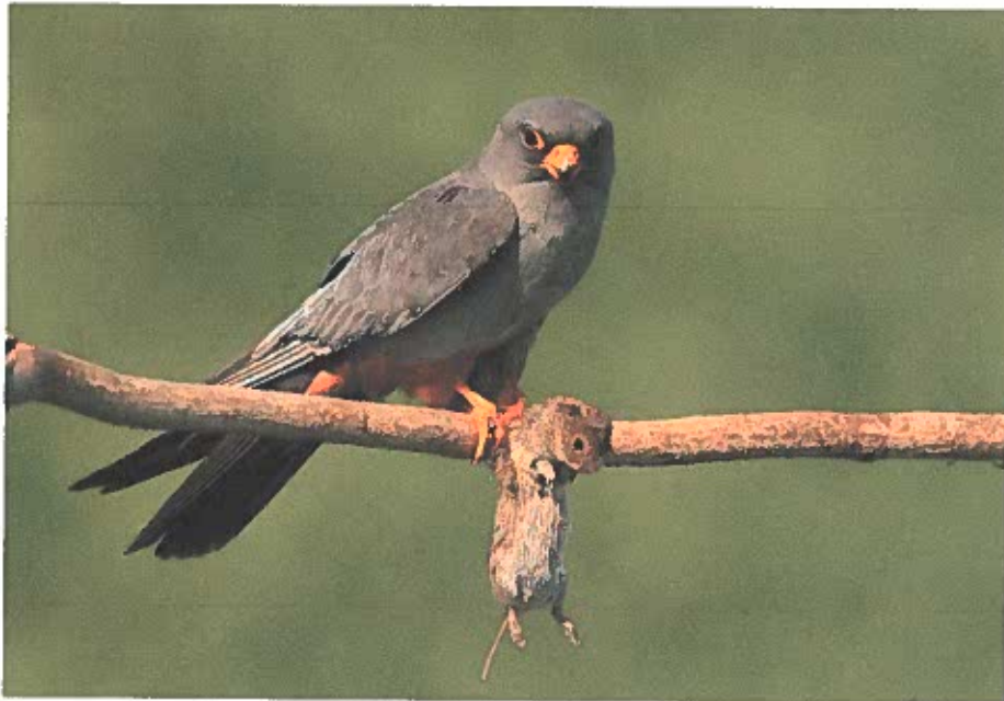
Az Igazgatóságunk koordinálásával futó magyar-román határon átnyúló pályázat partnere az Erdélyi-szigethegység Természeti Park Igazgatóság volt 2013-ban

Igazgatóságunk vezetésével és az Erdélyi-szigethegység Természeti Park Igazgatóság partnerségével 2013-ban futó HURO/1001/302 számú magyar-román határon átnyúló pályázat eredményeként közös hírlevél, a tűzok védelméről szóló közös kiadvány, ökoturisztikai térkép, tájékoztató táblák jelentek meg, és összehangolt monitoring tevékenység zajlott.