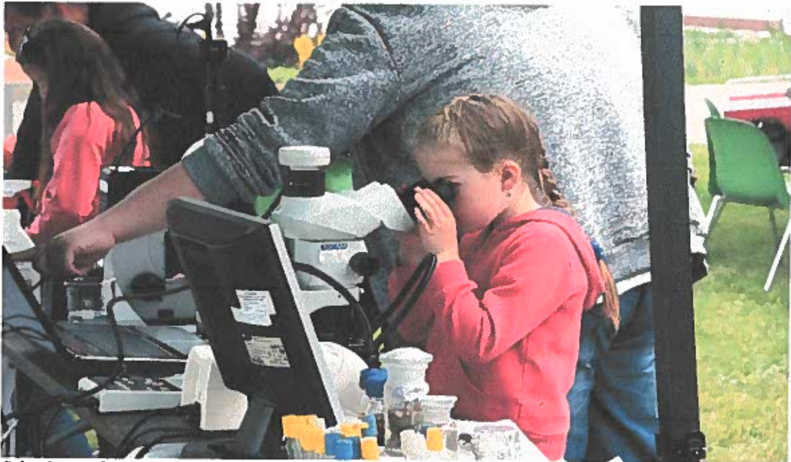
Látványos bemutató az Alföldvíz Zrt. standján a II. Túzokfesztiválon, Dévaványán

Az előző évekhez hasonlóan folytatódott az együttműködésünk több felsőoktatási intézménnyel a hallgatók gyakorlati képzésére vonatkozóan illetve a középiskolákkal iskolai közösségi szolgálat keretében.