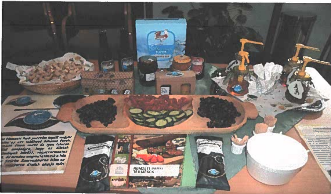
Az Igazgatóság Nemzeti Parki Termék védjegyet nyert termékei

Védjeggyel rendelkező termelőinket támogatjuk a rendezvényeinken való megjelenéssel is.