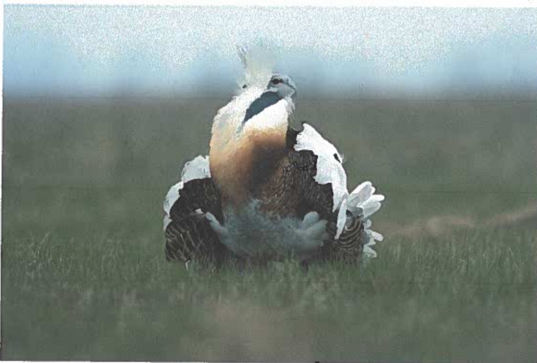
A tűzok (Otis tarda) a Nemzeti Park címermadara. Állománynövekedésének fenntartása, a nemzeti parki és a kapcsolódó romániai és szerbiai határ menti állományok összehangolt megerősítése az egyik legkiemelkedőbb feladat

Az Európai Unió szempontjából is kiemelt jelentőségű fajok védelmére a közvetlen uniós koordinálású LIFE programok biztosítottak többlet lehetőséget. Igazgatóságunk a tűzok ( Otis tarda ), a parlagi sas ( Aquila heliaca ) és a kék vércse ( Falco vespertinus ) állományának megerősítését szolgáló nemzetközi programokban működik közre.