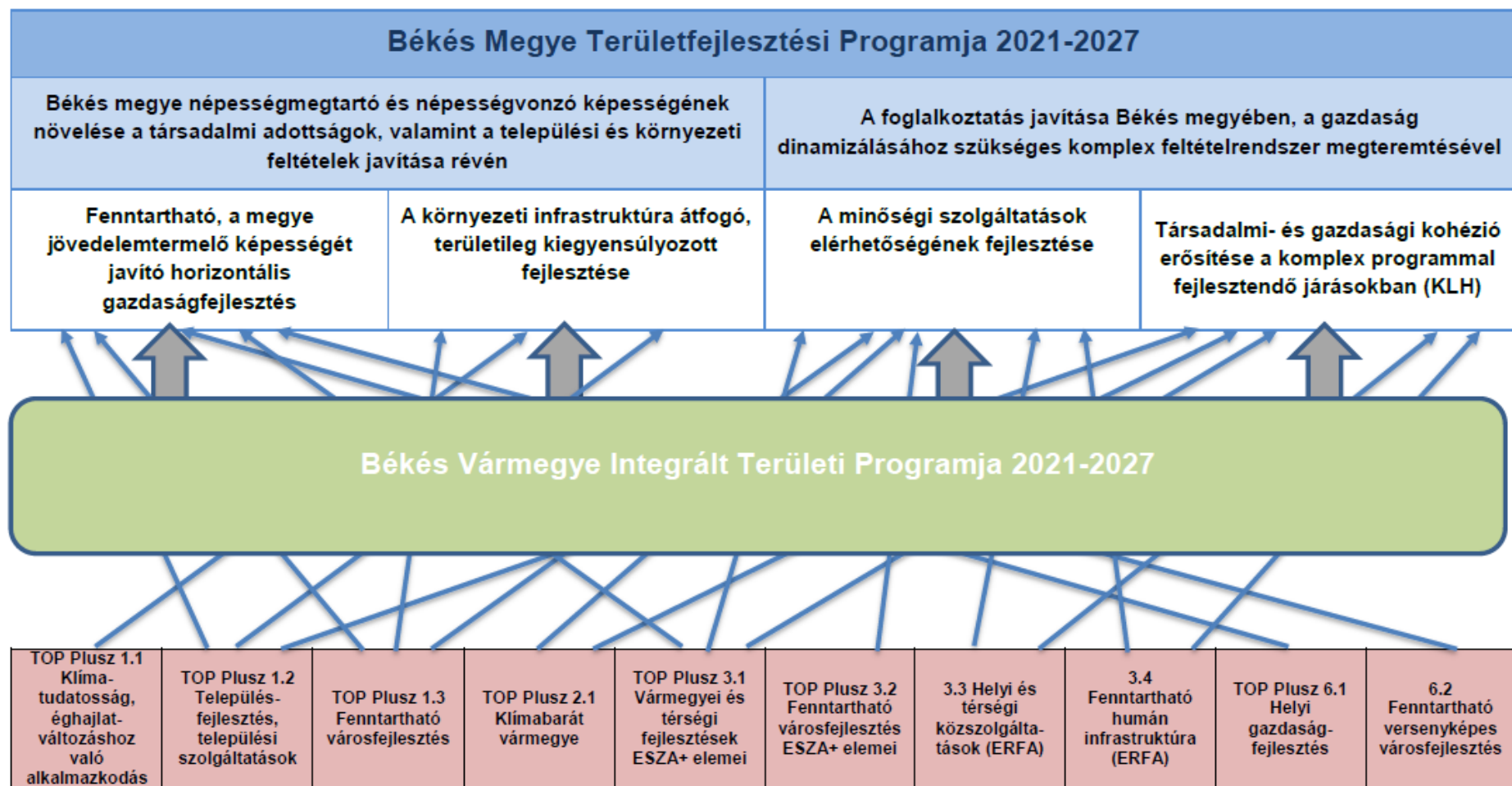
1. ábra: Békés Vármegye Integrált Területi Programjának viszonya a vármegyei területfejlesztési programhoz és a TOP Pluszhoz