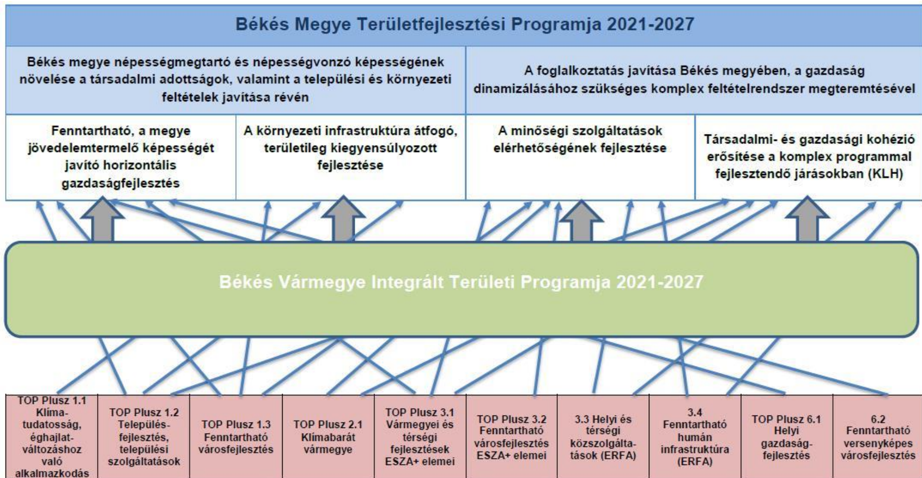
1. ábra: Békés Vármegye Integrált Területi Programjának viszonya a vármegyei területfejlesztési programhoz és a TOP Pluszhoz